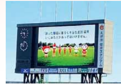
※昨年度の人権啓発 CM

ロアッソ熊本のホームゲーム第13戦（対・Y.S.C.C.横浜戦）を「ラブミンマッチ」（人権啓発マッチ）として開催いたします。 【ロアッソ熊本 VS Y.S.C.C.横浜】 日 時：令和3年(2021年)11月21日（日）13時10分 キックオフ 場 所：えがお健康スタジアム