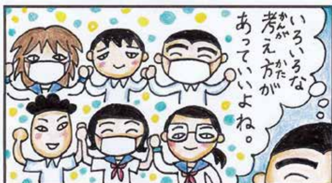
(漫画：圓山道子さん)