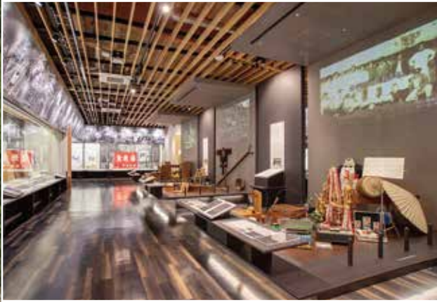
菊池恵楓園歴史資料館