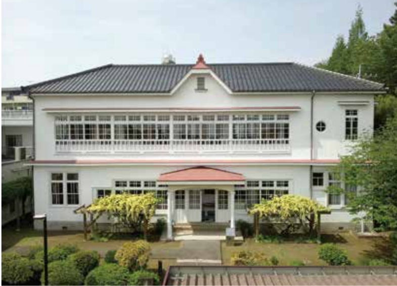
リデル、ライト両女史記念館