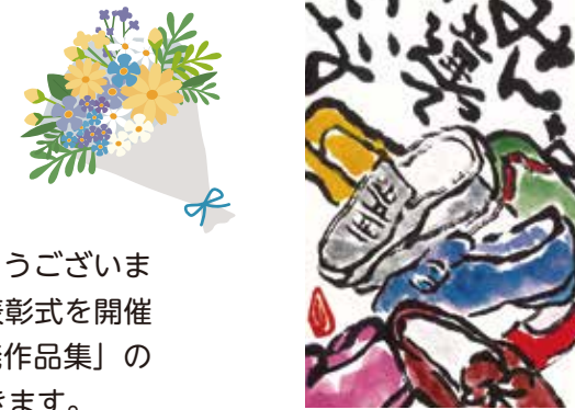
(令和4年度絵手紙部門優秀賞受賞作品)

令和5年度人権啓発作品募集に多数のご応募いただきありがとうございました。最優秀賞・優秀賞・特別賞等の審査を行い、12月上旬に表彰式を開催する予定です。選出されました作品は「市政だより」・「人権啓発作品集」の掲載や表彰式会場での展示など人権啓発に広く活用させていただきます。