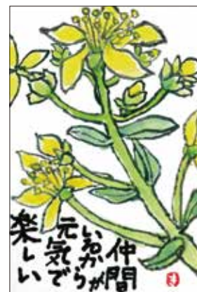
(令和5年度絵手紙部門最優秀賞受賞作品)

熊本市人権啓発市民協議会では、さまざまな人権テーマについて15名の講師の方にご登録いただいております。人権協ホームページにも掲載しておりますので、人権に関する講演会、研修会、学習会を計画の際は、ぜひお役立てください。(ご依頼の連絡は直接講師の方へお願いいたします。) 掲載のご了承をいただきました講師のみ掲載しております。(記載内容はホームページより抜粋) ※会員は助成金の活用ができます。計画の際はご相談ください。