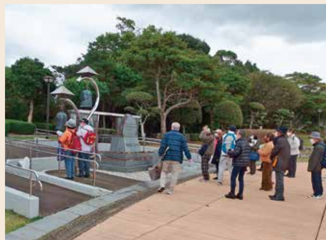
※写真は前回の様子です。